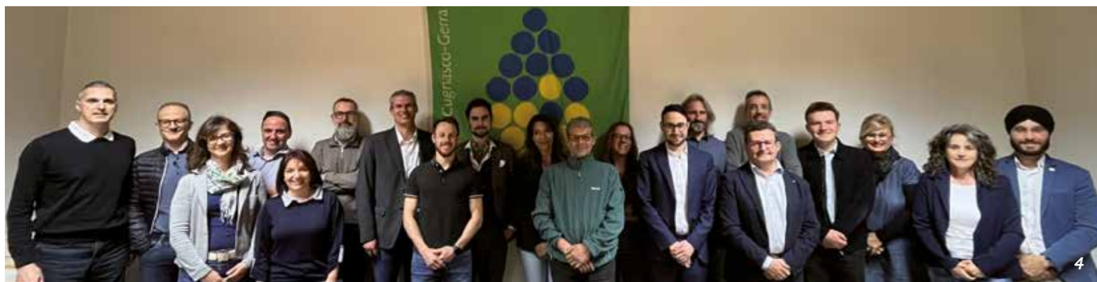
1] Alcuni aiutanti al pranzo anziani 2023