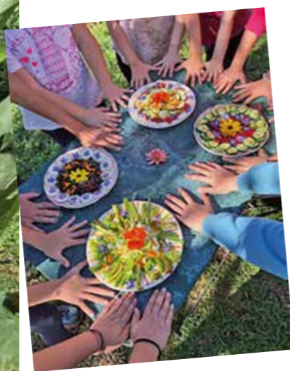
1] Bambini al lavoro nell'orto